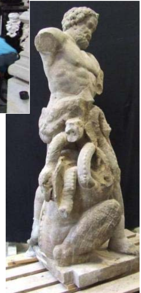
Hercules in gevecht met hydra van Lerna 18 de eeuw, afkomstig uit De Schaffelaar, Barneveld NL