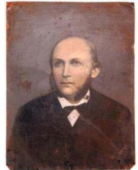
Roest onder collodiumemulsie van een ferrotypie