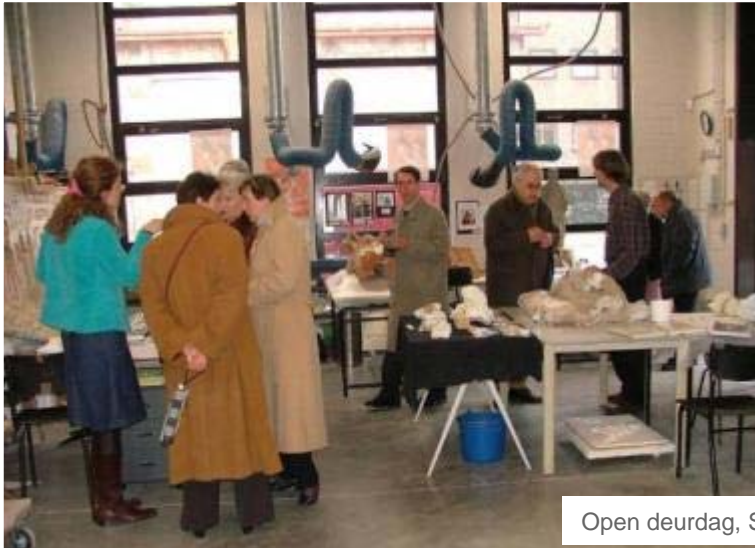
Open deurdag, Studio STEEN