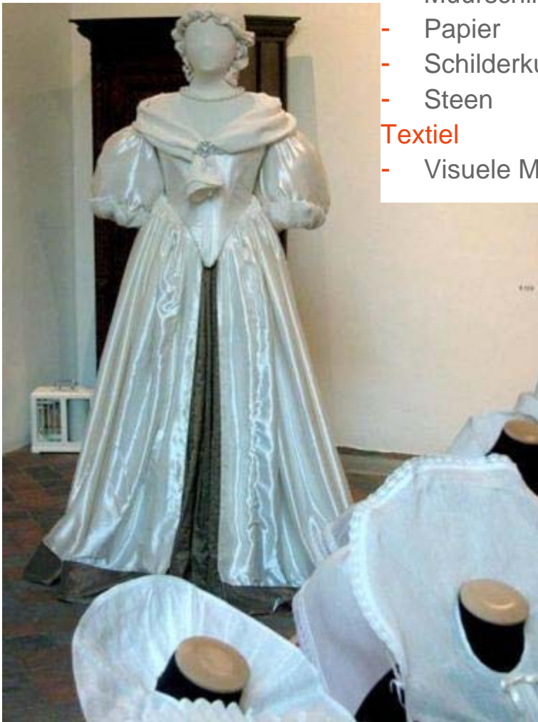
Kopie historisch kostuum