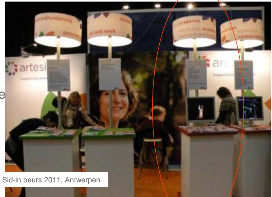
Sid-in beurs 2011, Antwerpen