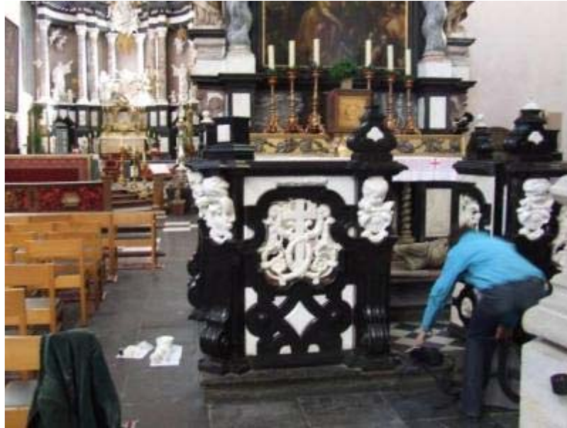
Restauratie 17 de eeuwse altaartuin, St. Andriesskerk, Antwerpen