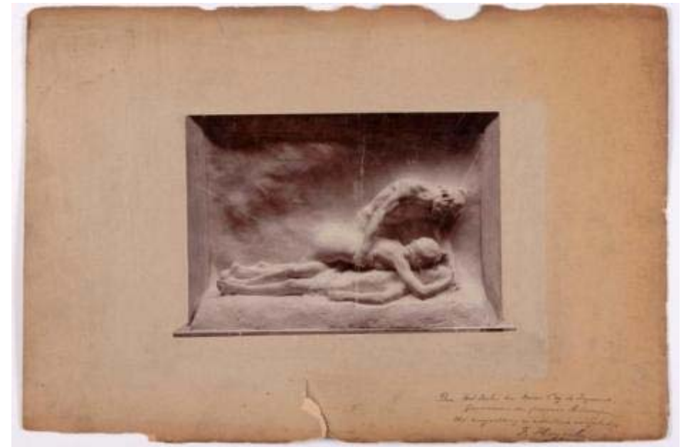
Gedegeneerd opzetkarton Foto: reliëf: Prijs van Rome 1900