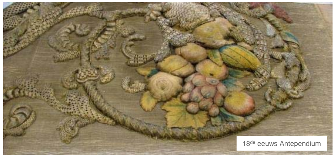
18 de eeuw Antependium