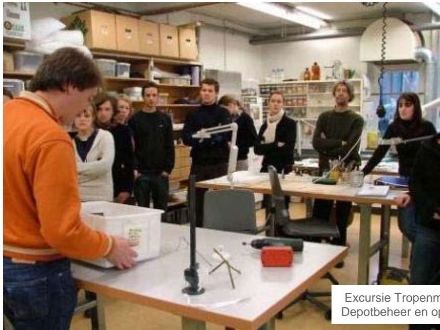
Excursie Tropenmuseum Amsterdam NL Depotbeheer en opstellingen

Internationaal samenwerkingsverband tussen vier opleidingsinstituten Conservatie / Restauratie