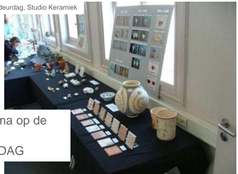
Open deurdag, Studio Keramiek

Ook open bij gepast thema op de ERFGOEDDAG OPEN- MONUMENTENDAG