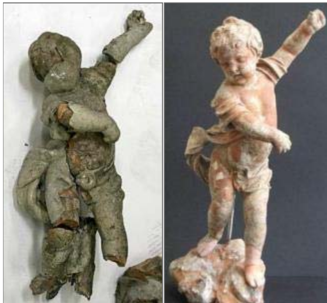
Madonna , Keistraat Antwerpen (VZW Voor Kruis & Beeld) Terracotta objecten met 110 afwerkingslagen, vermoedelijk Walter Pompe, 18de eeuw